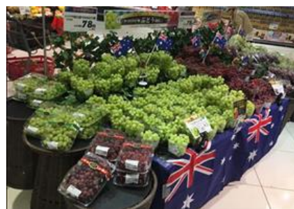
昨年のぶどう売場