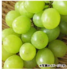
トンプソン・シードレス