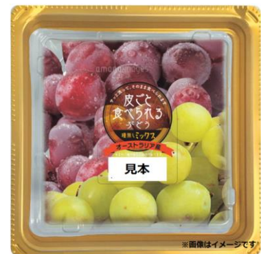
皮ごと食べられるぶどう (緑・赤ミックス) 250g

※緑の品種はトンプソン・シードレス、赤の品種はクリムゾン・シードレス、ミックスは両品種を入れた商品です。 ※販売店舗は「マックスバリュ グランド」「マックスバリュ エクスプレス」「マックスバリュ」「ミセススマート」「ザ・ビッグ エクスプレス」の全117店舗です。 ※店舗により販売する商品は異なります。