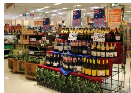
昨年のオーストラリアフェア売場