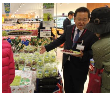
昨年の試食イベントの様子

※緑の品種はトンプソン・シードレス、赤の品種はクリムゾン・シードレス、ミックスは両品種を入れた商品です。 ※販売店舗は「マックスバリュ グランド」「マックスバリュ エクスプレス」「マックスバリュ」「ミセススマート」「ザ・ビッグ エクスプレス」の全117店舗です。 ※店舗により販売する商品は異なります。